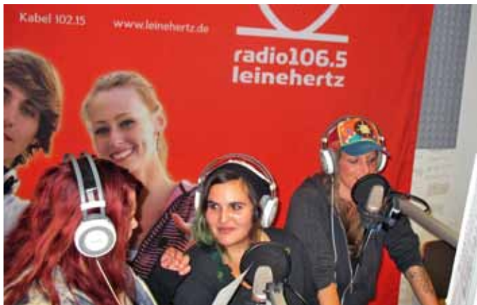
Im Studio mit Radio Sina.

Alexandra* blickt auf die Uhr ihres Smartphones und wartet darauf, dass der Empfangsdienst sie durch die Eingangstür lässt. In wenigen Minuten startet der Arbeitstag bei SINA. Ein freundliches „Guten Morgen“ und „danke“ werden ausgetauscht und schon sitzt sie an ihrem Schreibtisch im Radiobüro und fährt den PC hoch. Es ist Dienstag – ein Blick auf den Wochenplan zeigt, dass heute eine Redaktionsbesprechung ansteht. Außerdem hatte „Radio SINA“ gestern eine Livesendung bei Radio Leinehertz. Da Alex die Arbeitsab-